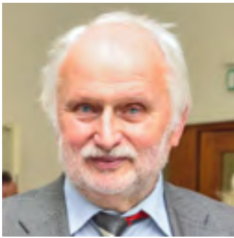
von Dr. Josef Bura

„Kommunen und Wohnprojekte können ziemlich beste Freunde werden.