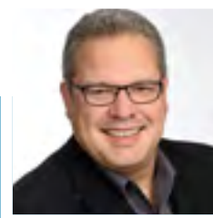
Cord Soehlke Baubürgermeister Tübingen

Informationen zu neuen Quartieren und Vergabeverfahren auf der städtischen Internetseite der Universitätsstadt Tübingen: www.tuebingen.de/wohnen