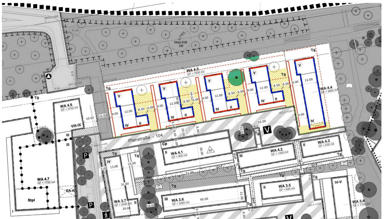
Abbildung: Grundstück im Ausschnitt aus dem Bebauungsplan Nr. 144 „General-von-Stein-Kaserne“

Die Entscheidung beruht auf der Überzeugung, dass Genossenschaften durch eine Kostenmiete zur Dämpfung der Miet- und Bodenpreise beitragen und durch das Teilen von Räumen und Fahrzeugen ihre Wohnflächen und Mobilität effizient gestalten. Konkret entstehen im Rahmen des Projektes „ Genossenschaftliches Bauen im SteinPark “ rund 80 Wohneinheiten in fünf Baukörpern auf einem Baufeld des neuen Areals. Im Rahmen eines Konzeptverfahrens wird das gesamte Grundstück in Erbbaurecht an eine Genossenschaft vergeben. Zielgruppe des Projektes ist die vorwiegend ortsansässige Bevölkerung mit verschiedenen Einkommensstufen. Die Zielmiete liegt bei dem ortsüblichen Wert von 12,50 € mit 80-jähriger Bindung, außerdem sollen 25 bis 30 Prozent sozialer Wohnungsbau realisiert werden.